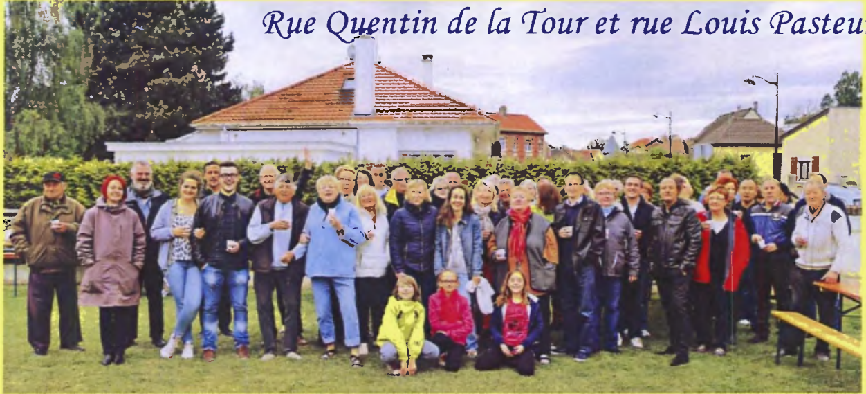
Rue Quentin de la Tour et rue Louis Pasteur

Les Fayellois ont tenu à respecter la tradition qui depuis des années veut réunir les habitants d'un même quartier pour partager un moment convivial.....(pas de photos des autres rues)