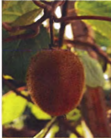
Kiva sur sa branche

Taillez aubergines, poivrons et melons pour une meilleure fructification. Pour augmenter le goût de ces derniers, diminuez les arrosages dès le mûrissement.