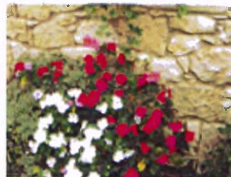
› Plantes d'intérieur, travaux divers