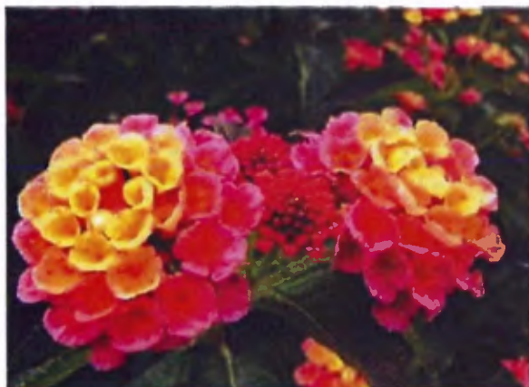
Lantana en fleurs

Supprimez les fleurs fanées des rhododendrons .