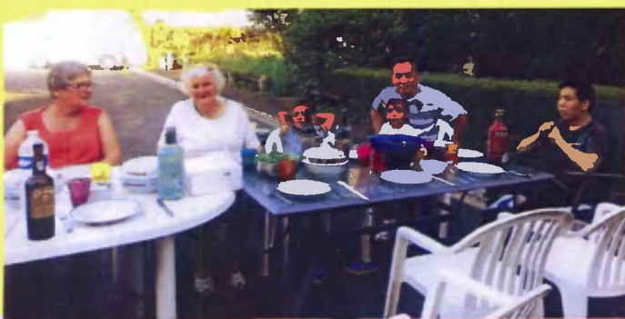
Rue Jean Racine